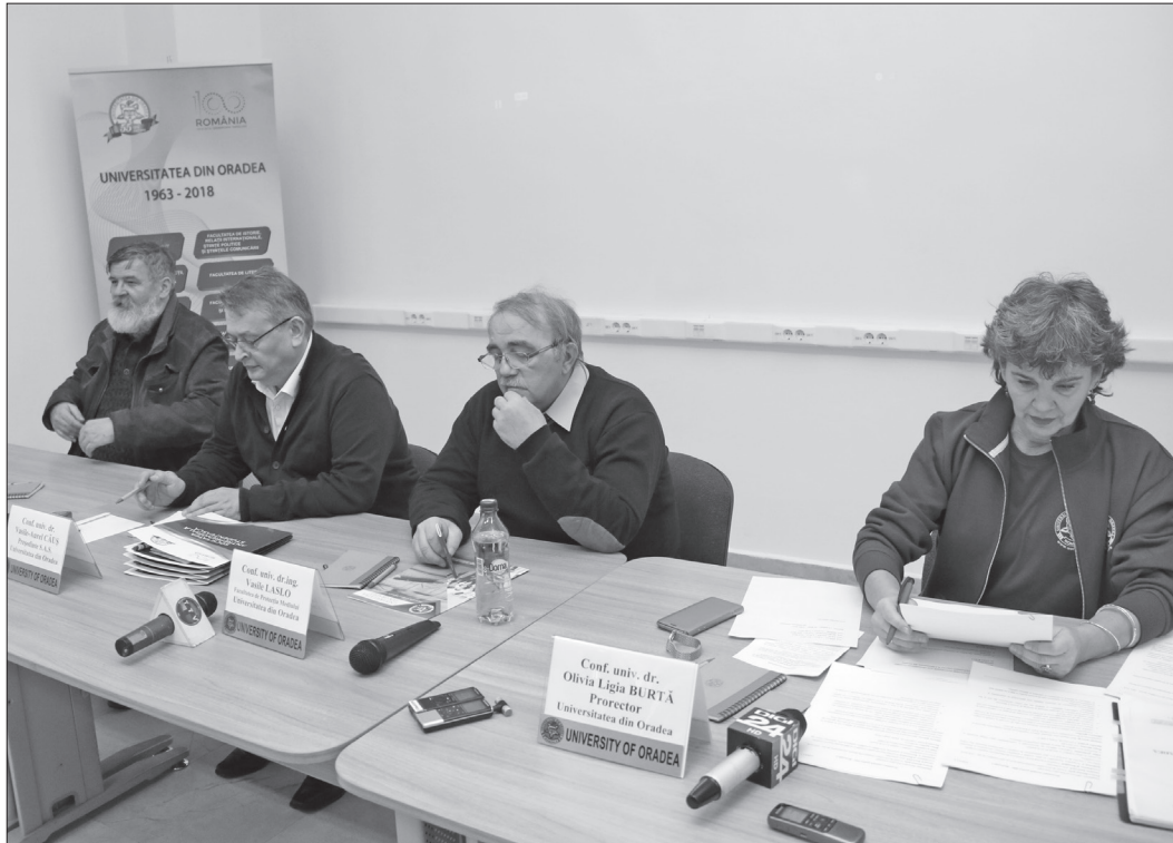
Valoarea celor patru proiecte este de 661.000 de lei