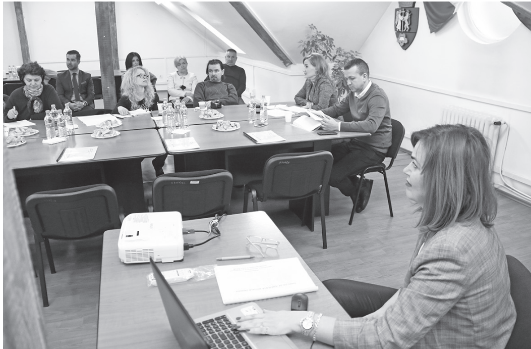
Se remarcă scăderea semnificativă a numărului dosarelor de ajutor social