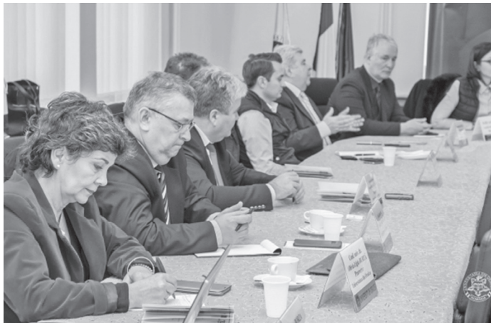
Oaspeții sunt interesați să încheie parteneriate public-private

„Firmele participante din Germania doresc să colaboreze cu companiile din Bi-