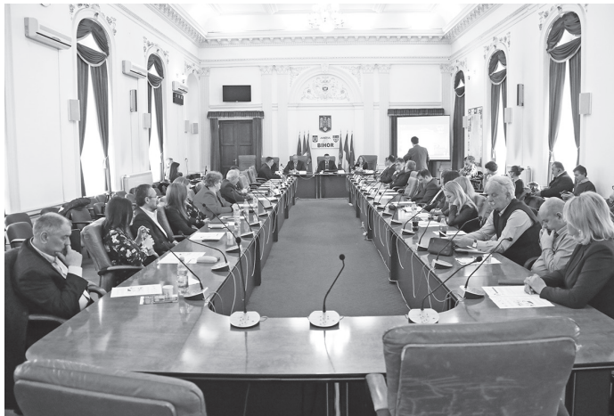
Dare de seamă la Prefectura Bihor

învățământ. Totodată, a fost prezentat proiectul JOINTIS-ZA – „Consolidarea cooperării în cadrul realizării planurilor de management a bazinelor hidrografice și a planurilor de prevenire a riscului la inundații pentru îmbunătățirea stării apelor în Bazinul Tisei/ Strengthening”. Proiectul, care trebuie să se finalizeze în luna iunie 2019, este elaborat și implementat de 17 parteneri din cinci state – România, Ungaria, Serbia, Slovacia și Ucraina, care au suprafețe situate în bazinul hidrografic al râului Tisa. Valoarea totală a proiectului este de 2.254.127 euro, din care 446.000 euro revin partenerilor români, finanțarea fiind asigurată prin Programul Interreg V-B al Uniunii Europene. Pe de altă parte, prefectul Ioan Mihaie a menționat că Guvernul a alocat Ministerului Apelor și Pădurilor un buget cu 30% mai mare comparativ cu anul precedent, ceea ce „va permite susținerea investițiilor demarate și continuarea altor proiecte”. Tot reprezentantul Guvernului în Bihor a vorbit despre programul de irigații