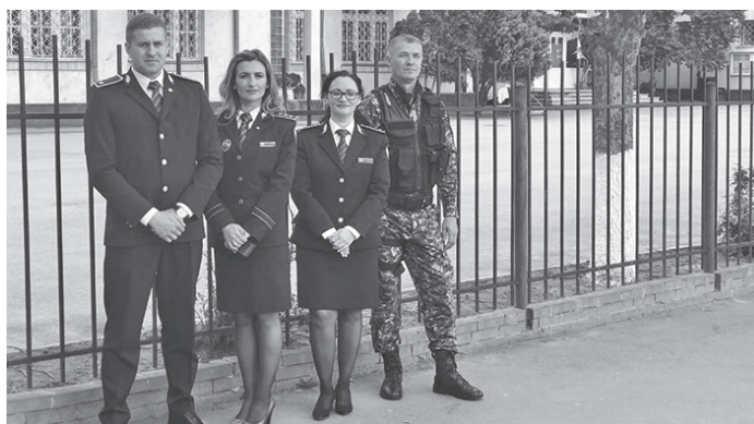
Oferta este generoasă

Înscrierile pentru locurile destinate Administrației Naționale a Penitenciarelor la instituțiile de învățământ se pot face la sediul Penitenciarului Oradea, Parcul Traian nr. 3, Biroul de Resurse Umane și Formare Profesională, telefon: 0259.419.881, interior 128.