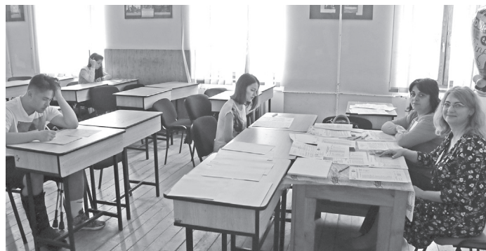
La concurs au participat în jur de 30 de copii