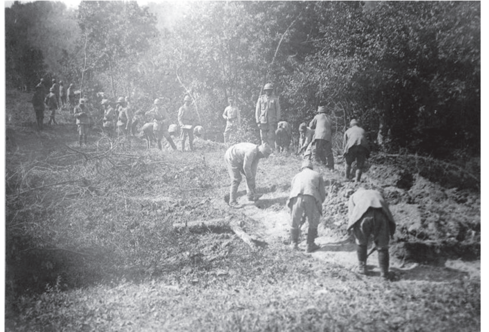
Trupe române amenajând poziții defensive într-o pădure; artileriști români.

Prin telegrama nr.59 din 28 septembrie 1916, generalul Alexeieff, după ce avusese discuție cu țarul Nicolae al II-lea, avea să