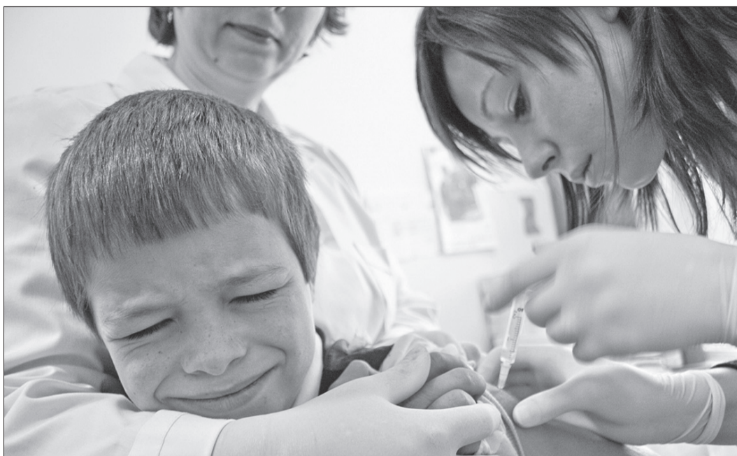
Părintele este responsabil pentru copilul lui

Referitor la ultimul val epidemic de rujeolă din țara noastră (2007-2008), chiar dacă acoperirea vaccinală la nivel național a atins ținta Organizației Mondiale a Sănătății (OMS), au existat colectivități cu acoperire vaccinală suboptimală iar valul epidemic a pornit din aceste colectivități și a afectat toți copii receptivi (sub vârsta vaccinării sau nevaccinați). Au existat cazuri de rujeolă și la copii vaccinați, dar incomplet - fără toate dozele, însă forma clinică în aceste cazuri a fost ușoară,