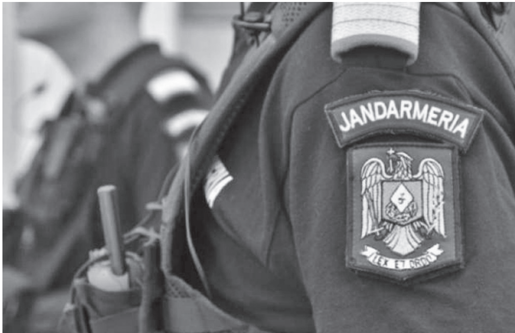
Termen pentru finalizarea dosarului, 10 martie

În ordinea preferințelor, 53 de tineri au optat pentru Școala de Subofițeri Jandarmi „Petru Rareș” Fălticeni și 10 pentru Școala Militară de Subofițeri Jandarmi „Grigore Alexandru Ghica” Drăgășani. Reprezentanții Inspectoratului de Jandarmi Județean Bihor reamintesc că până pe data de 10 martie, toți candidații au obligația să completeze dosarul cu următoarele documente: cererea de înscriere; curriculum vitae - Europass (CV); copii ale documentelor care atestă nivelul și specializarea studiilor, respectiv diploma de bacalaureat și foaia matricolă a studiilor liceale; se acceptă și copii legalizate. Pentru candidații care au studii liceale în afara României cu diplomă de bacalaureat (sau echivalentul acesteia) – atestatul de recunoaștere a studiilor, eliberat de direcția de specialitate din cadrul MENCȘ, în copie; se acceptă și copie legalizată; diploma de bacalaureat sau echivalentă cu aceasta, în traducere legalizată; foaia matricolă a studiilor liceale în traducere legalizată. De asemenea, candidații trebuie să depună copii ale actului de identitate, carnetului de muncă/certificatului stagiu de cotizare și/sau altor documente dovedite