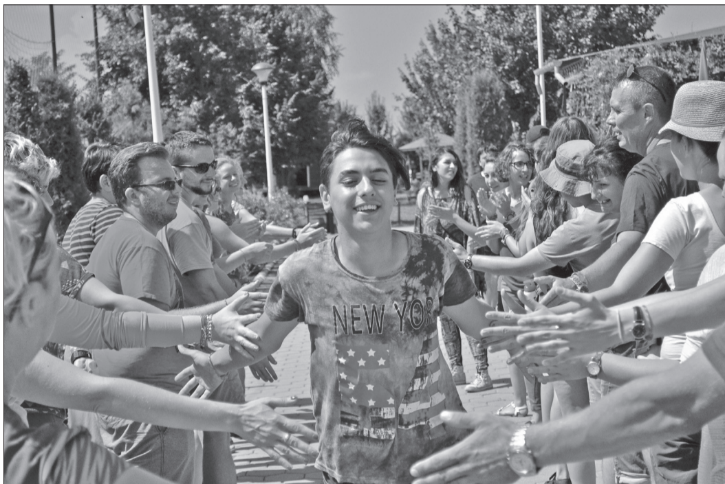
Consilierii răspund la întrebările legate de viața cotidiană a copilului cu diabet

„În cadrul acestor întâlniri dorim să informăm participanții cu privire la proiect: consilierea care le stă la dispoziție, taberele terapeutice, grupurile de suport pentru aparținători. De asemenea, dorim să răspundem la întrebările lor legate de viața co-