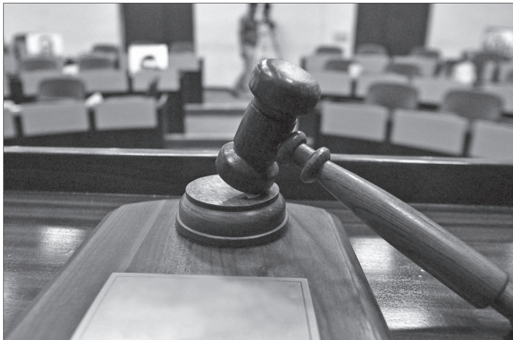
Legile trebuie dezbătute public

„Uniunea Națională a Judecătorilor din România și Asociația Magistraților din România vă solicită să dispuneți Ministrului Justiției, domnul Tudorel Toader, să publice de îndată pe site-ul ministerului proiectul de modificare a Legilor Justiției, pentru ca acesta să poată fi dezbătut public, astfel încât toate persoanele interesate să îl poată analiza și veni cu propuneri în vederea îmbunătățirii lui. Pe data de 23 august 2017, Ministrul Justiției Tudorel Toader a anunțat, în cadrul unei conferințe de presă, principalele modificări propuse la Legile Justiției. (...) Această prezentare nu a fost însă însoțită de publicarea efectivă pe site-ul Ministerului Justiției a proiectului propriu-zis de modificare, care să permită consultarea acestuia și formarea unei opinii bazate pe o analiză proprie, sistematică, a întregului proiect de lege”, se arată în scrisoarea comună transmisă de Uniunea Națională a Judecătorilor din România (UNJR) și Asociația Magistraților din România (AMR) premierului Mihai Tudose. Asociațiile de magistrați transmit că, în lipsa unui proiect de lege efectiv, „discuțiile divergente motivate politic sau partinic au luat locul unei extrem de necesare discuții profesionale și aplicate, pe fiecare propunere în parte, dat fiind că unele par a fi modificări de substanță”. „Ar fi extrem de periculos ca ministrul Justiției să repete nefericita practică a adoptării hotărârii