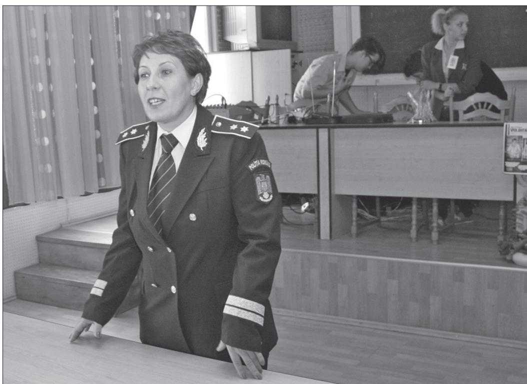
Polițiștii vor implica din nou copiii în proiecte și campanii preventive

Polițiștii vor fi alături de elevi, părinți și cadre didactice, pentru a reconfirma parteneriatul Poliție - Școală, dar și pentru a adresa recomandări preventive tuturor celor implicați în activitatea școlară, siguranța copiilor reprezentând una din prioritățile permanente ale polițiștilor bihoreni. Totodată, pe întreg parcursul anului școlar, polițiștii bihoreni vor desfășura activități specifice, care să conducă la îmbunătățirea și menținerea climatului de siguranță în incinta și zona adiacentă unităților de învățământ preuniversitar pe raza Județului Bihor. Echipajele de poliție vor fi prezente, zilnic, în zona intrărilor în școli, în intervalele orare în care se efectuează intrarea și ieșirea de la cursuri a elevilor. De asemenea, traseele de deplasare a elevilor vor fi supravegheate în permanență de polițiștii bihoreni.