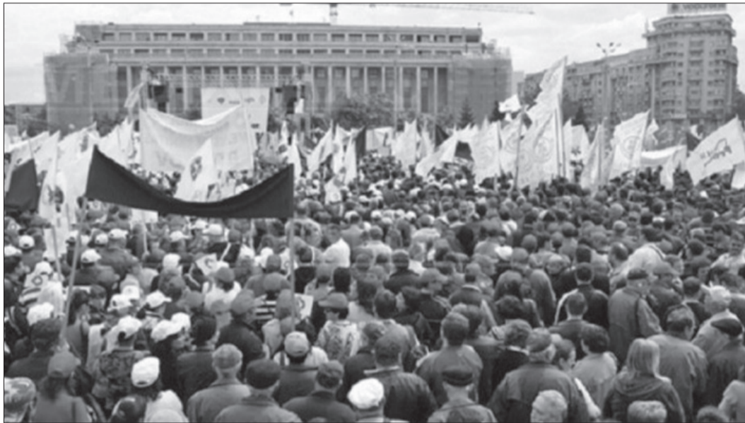
Premierul a anunțat că nu s-a renunțat la transferul contribuțiilor către angajat

Principalele revendicări ale protestatarilor se referă la blocarea transferului taxelor sociale de la angajator către angajat, dar și la modificarea Legii 62/2011, pentru deblocarea negocierii și încheierii contractelor colective de muncă. „Vrem să atragem atenția guvernanților asupra transferării taxelor de la angajator la angajat. Practic, nu mai există în spațiul european așa ceva și distruge modelul social european. Mecanismul care este pregătit va da un avantaj pentru angajator. Prin acest mecanism, lucrătorii se transformă în niste sclavi la dispoziția capitalului. Păcăleala că vor crește cu 25% înseamnă că nu vor avea nici netul de astăzi. Practic, dacă angajatorii atacă în justiție că nu sunt de acord, CCR va constata nulitatea actului și noi vom rămâne cu același salariu brut și transferarea taxelor ne va conduce la micșorarea cu 20