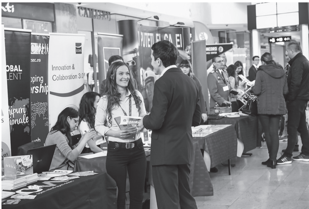
Evenimentul va avea loc la Trade Center

Peste 30 de companii și organizații participă la evenimentul de recrutare ce se va desfășura săptămâna viitoare la Oradea. Sunt așteptați toți cei care vor să facă următorul pas în viața lor profesională, mai ales că cele mai importante companii vin la Târgul de Cariere cu oferte de joburi, internships și programe de voluntariat. Printre companiile care vor participa la TdC Oradea se numără: berg COMPUTERS (IT&Software), Corporative Consulting (Recrutare), Inteva Products (Auto&Automotive), Nidec (Producție & Tehnică), Celestica (Producție & Tehnică), Eberspaecher Exhaust Technology (Auto&Automotive) Faist Light Metals (Producție & Tehnică), Penny Market (Retail&FMCG), Plexus (Producție & Tehnică), AJOFM Bihor (Recrutare), Stefanini (IT&Software) și Valiant TMS (Auto&Automotive). De asemenea, vor fi prezente Cerved Credit Collection SpA, Comau, Connect Group, Double Tree by Hilton, FinProm, H.Essers Oradea, KFC, KUKA, Leroy Merlin, McDonald's, Profi, RCS&RDS, RE/MAX Joy, Sykes, VPK Packaging și Universitatea din Oradea.