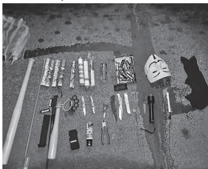
Toate armele au fost confiscate