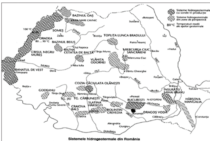
Harta sistemelor hidrogeotermale

În concluzie, aplicarea redevenței în forma propusă ar duce la debransări în masă ale consumatorilor, reducându-se