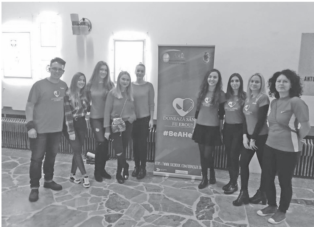
Susținătorii orădeni ai campaniei naționale

Proiectul „Donează sânge! Fii erou!” își propune să promoveze spiritul civic al comunității noastre, a adevăratelor valori, prin organizarea unor activități de suflet. Acest proiect urmărește depășirea crizei de sânge cu care se confruntă spitalele din România, prin organizarea unei campanii de donare de sânge desfășurată pe parcursul celor 5 zile la nivel național. Prin desfășurarea acestei campanii la nivel local, se urmărește informarea și sensibilizarea comunității cu privire la importanța actului donării, la efectele grave ce pot rezulta în urma lipsei de sânge și totodată se dorește mobilizarea a cât mai mulți locuitori ai orașului să vină să doneze sânge, atât pe timpul desfășurării campaniei, cât și în afara acestuia. Voluntarii precizează că au nevoie de susținerea tuturor pentru a atinge succesul acestui proiect.