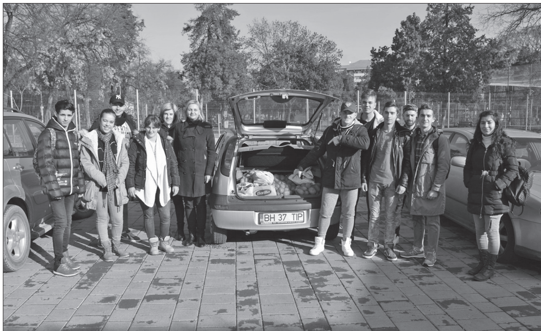
Elevii au adunat aproximativ 214 kg de alimente

„Am încercat să găsec un beneficiar serios pe piață, de care am auzit de ani de zile și cu care am vrut de mult să colaborez. De aceea am ales