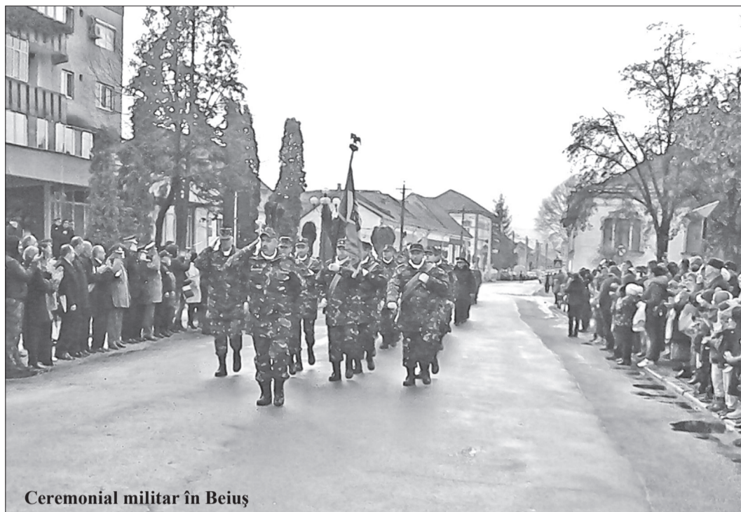
Ceremonial militar în Beiuș

Desigur, festivitatea dedicată Zilei de 1 Decembrie a marcat,