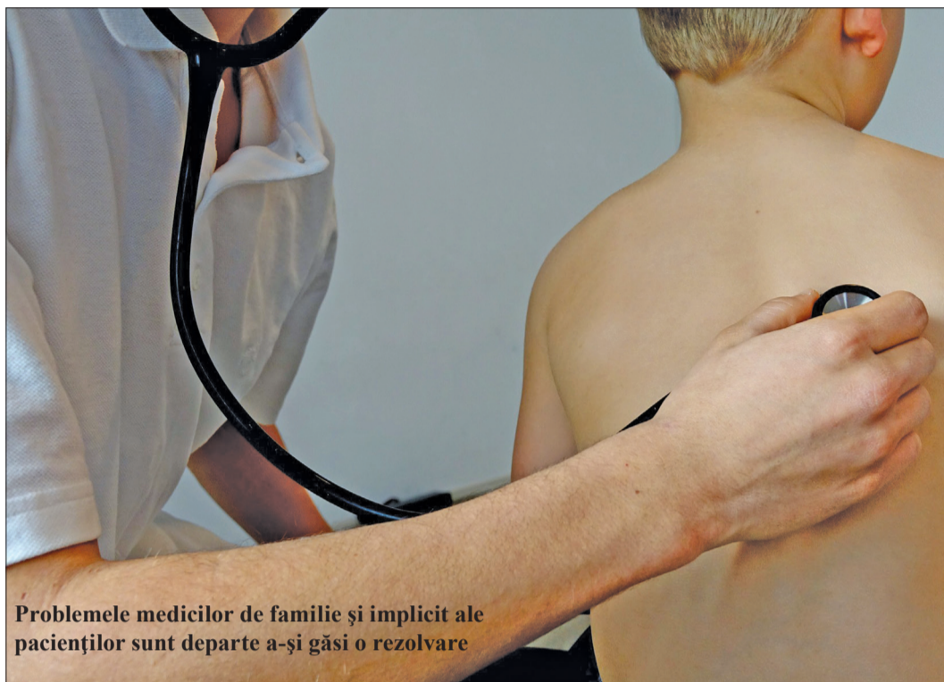
Problemele medicilor de familie și implicit ale pacienților sunt departe a-și găsi o rezolvare

De asemenea, s-a luat în discuție o serie de prevederi de debirocratizare a activității furnizorilor de servicii medicale și de creștere a accesului asiguraților la medicamente și servicii paraclinice finanțate de CNAS. „Se renunță complet la documentele pe hârtie în cadrul procesului de