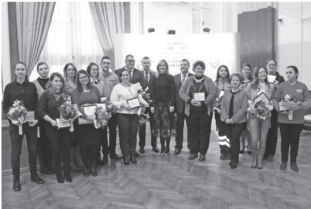
Au fost acordate premii pentru orădenii implicați în domeniul social

„Această gală reprezintă o formă minimă de respect din partea primăriei și a Consiliul