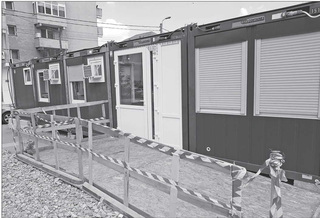
Două luni și jumătate, la container

„Partea veche a Unității de Primiri Urgențe, unde trebuie să se facă demolări, a trebuit golită. Tocmai de aceea s-a apelat la această soluție de a închiria 43 de containere, care oferă condițiile solicitate de Direcția de Sănătate Publică, până la mijlocul lunii septembrie. Le cerem scuze pacienților Spitalului Județean, dar asta a fost soluția cea mai bună pentru a putea continua activitatea medicală de urgență. Stadiul fizic al lucrărilor este acum de peste 75%, urmând ca încăperile din vechiul UPU să fie reamenajate. Menționăm însă că șantierele la Spitalul Județean nu se vor încheia, pentru că urmează lucrările de eficientizare energetică, respectiv de reabilitare termică și construcția viitorului ambulator al spitalului. Conducerea spitalului mulțumește încă o dată tuturor pacienților pentru înțelegere și se străduiește ca această perioadă de tranziție să fie una cât mai scurtă”, a menționat Ghe-