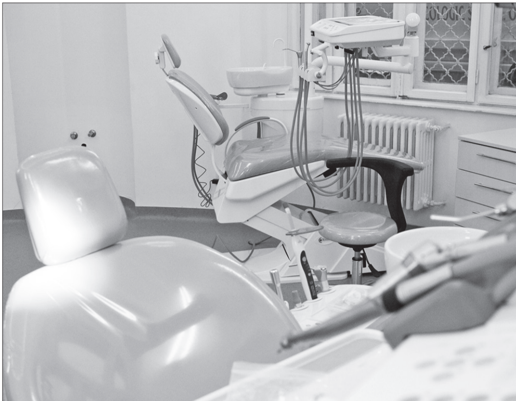
Medicina orădeană, un laborator pentru comiterea de infracțiuni

La finalul ambelor referate, procurorul care s-a ocupat de caz subliniază că „Fapta comisă are un puternic impact social în rândul populației pe fondul unei situații social – politice actuale în care societatea este zguduită de fapte de corupție comise de persoane din sistemul de învățământ. În acest context sistemul public de învățământ, mai ales în domeniul medical, este perceput de opinia publică ca fiind profund corupt, fiind de notorietate că pentru „a obține note de promovare a examenelor” este