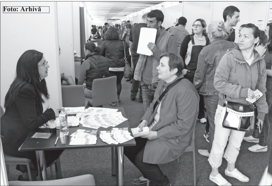
Evenimentul va avea loc la Centrul de afaceri Trade Center Oradea

a facilita întâlnirea persoanelor aflate în căutarea unui loc de muncă cu angajatorii din județul Bihor. Pe de o parte, vrem să ajutăm persoanele aflate în căutarea unui loc de muncă să-și găsească un job pe măsura pregătirii, calificării și experienței lor profesionale,