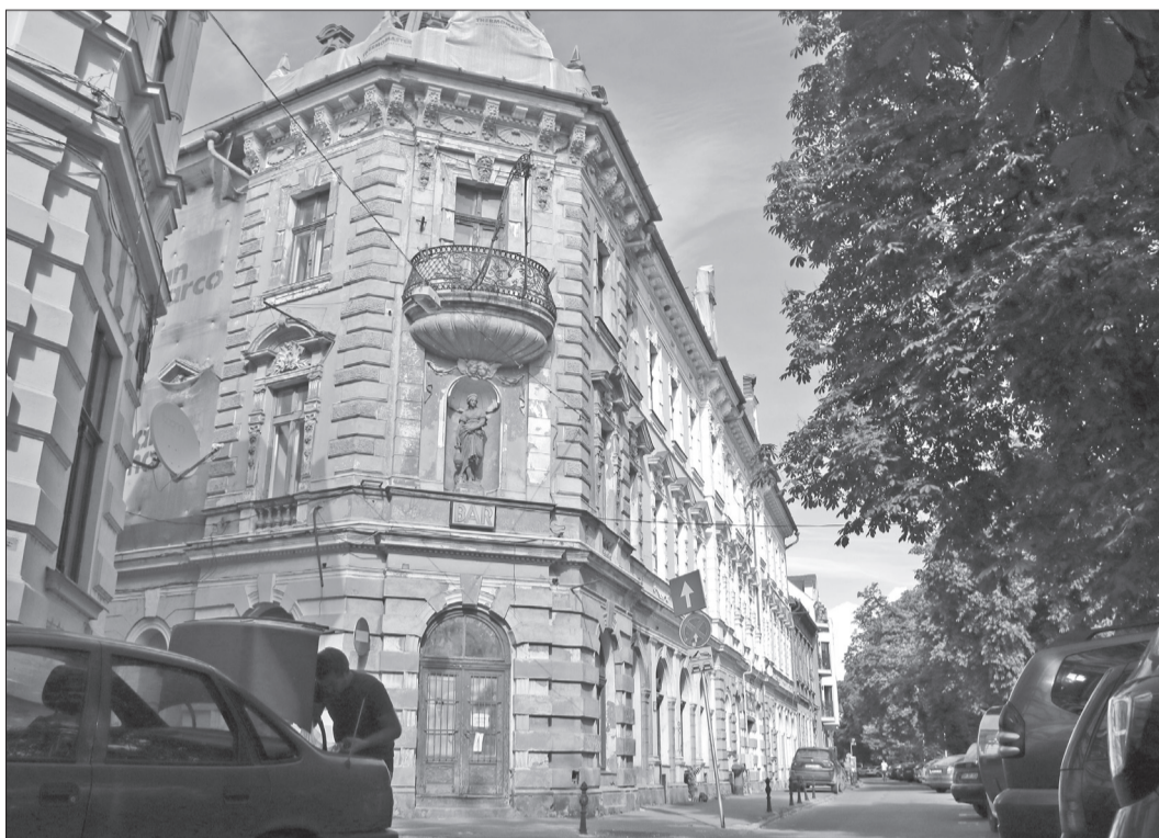
CJ Bihor se înhamă la un proces dificil de câștigat