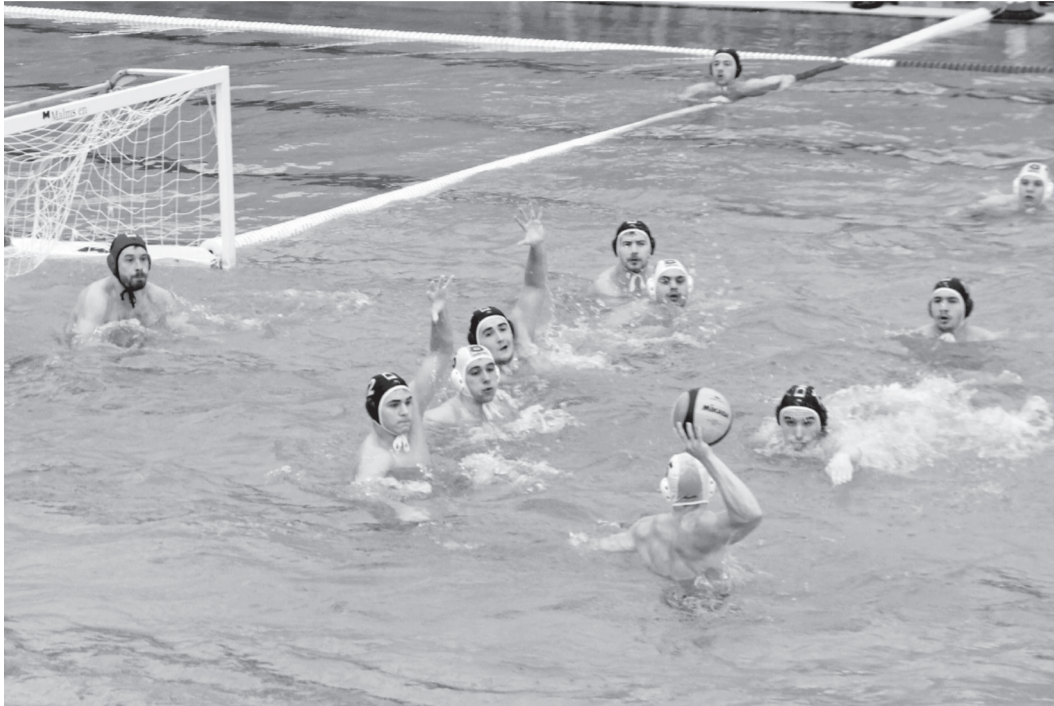
Vicecampiona României la polo are în lot patru jucători străini