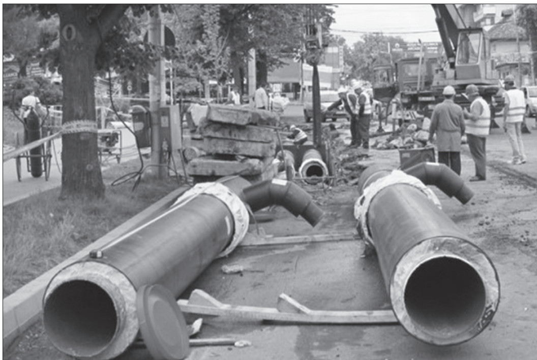
Orădenii vor rămâne fără apă caldă până în seara zilei de vineri, 14 iulie

Potrivit informațiile transmise de Termoficare Oradea, pentru continuarea lucrărilor de înlocuire și modernizare a rețelei de transport a energiei termice, în cadrul proiectului „Reabilitarea sistemului de termoficare urbană, la nivelul municipiului Oradea, pentru perioada 2009-2028, în scopul conformării la legislația de mediu și a creșterii eficienței energetice – etapa a II-a, 20,2 km rețea de transport”, începând de luni, 10 iulie până vineri, 14 iulie 2017, se întrerupe furnizarea apei calde pentru consumatorii alimentați din punctele termice termice: 409, 410, 411, 509, 516, 521, 522, 523, 820, 825, 849, 850, 910, 911, 913. Se vor efectua lucrări în zona intersecției străzilor Sextil Pușcariu și Beiușului, în Parcul Traian, pe str. Oneștilor și pe B-dul Decebal, pe tronso-