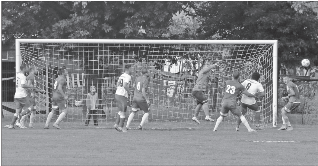
CS Diosig n-a avut nicio șansă în fața unui adversar dintr-un eșalon inferior

Național Sebiș: Moroz – Siminic, Bărnel, Basic, Dumitrache – Pîslaru, Livan – Săulescu, Petculescu, Cl. Vereș – Ionică. Antrenor: Alin