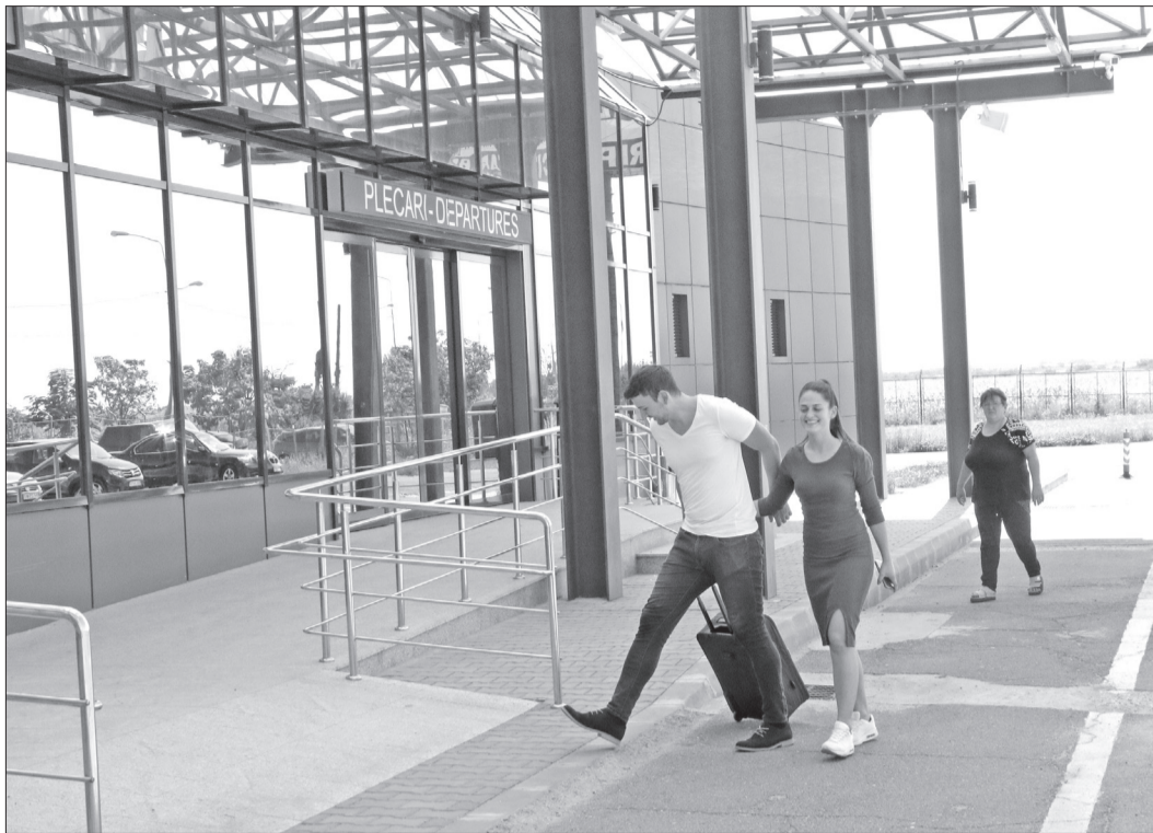
Aeroportul Oradea deține 180 de hectare de teren, 40 fiind nefolosite

CJ Bihor menționează că Airport City este un concept care funcționează cu succes în alte orașe din Europa și se referă la extinderea serviciilor oferite de un aeroport, astfel încât