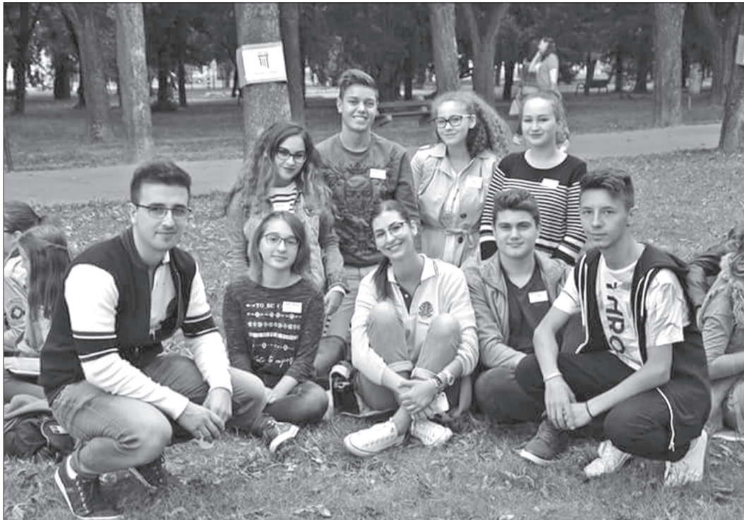
Luna septembrie a fost bogată în activități la Clubul Leo „Black Eagle” Oradea

La scurt timp, în 10 septembrie 2016, Clubul Leo „Black Eagle” Oradea a organizat petrecerea caritabilă „Nopti de Vamă”. Evenimentul a avut loc la Moszkva Cafe și s-a desfășurat în două etape: în aer liber până la ora 23:00 și, mai apoi, în partea de sus a