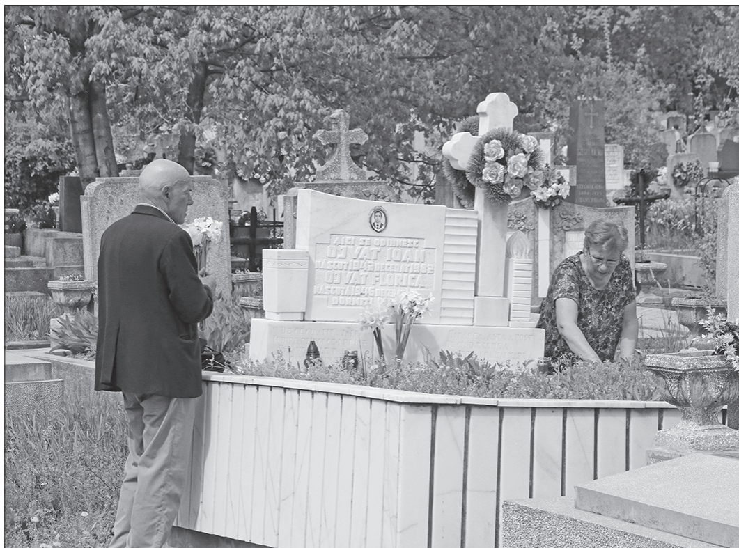
Credincioșii s-au pregătit întreaga săptămână pentru acest eveniment

Sâmbătă, oamenii au mers la Cimitirul Municipal „Rulikowski” doar să pregătească mormintele, pentru ca a doua zi, însoțiți de preoți și încărcăți cu pomeni, să revină la mormântul celor dragi. Credincioșii au adus ieri cu ei ouă roșii, bucați de cozonac și flori.