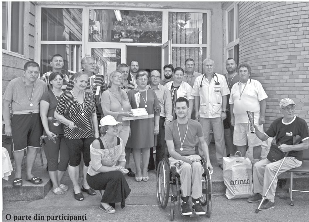
O parte din participanți

Jocul de table îndrăgit și practicat de multă lume, antrenant și o modalitate rapidă de socializare a „prins” și printre pacienții spitalului. De-a lungul celor 10 ediții, desfășurate de regulă în luna iulie, tot mai mulți pasionați ai acestui joc au participat la un concurs adevărat, cu un regulament propriu, dotat cu diplome și premii. Făcând o statistică, la ceas aniversar, în cei 10 ani de concurs sau înscriși și au participat peste 200 de jucători, la care sau adăugat și alte câteva sute de „chibiți”. Jocul în sine a produs multă bucurie participanților și în mod special celor care își duc viața în cărucioare, care au declarat beneficierea acestui concurs pentru starea lor psihică, întărind speranța și într-o recuperare fizică. Cu acest prilej sau stabilit relații de prietenie între concurenți, creându-se cu timpul o adevărată familie, a căror relații au dăinuit pe tot parcursul anilor. Asociația sportivă constituită cu numele „Speranța”, prin conducătorii săi s-a străduit să creeze o ambianță deosebită în timpul concursului, asigurând corectitudinea derulării sale.