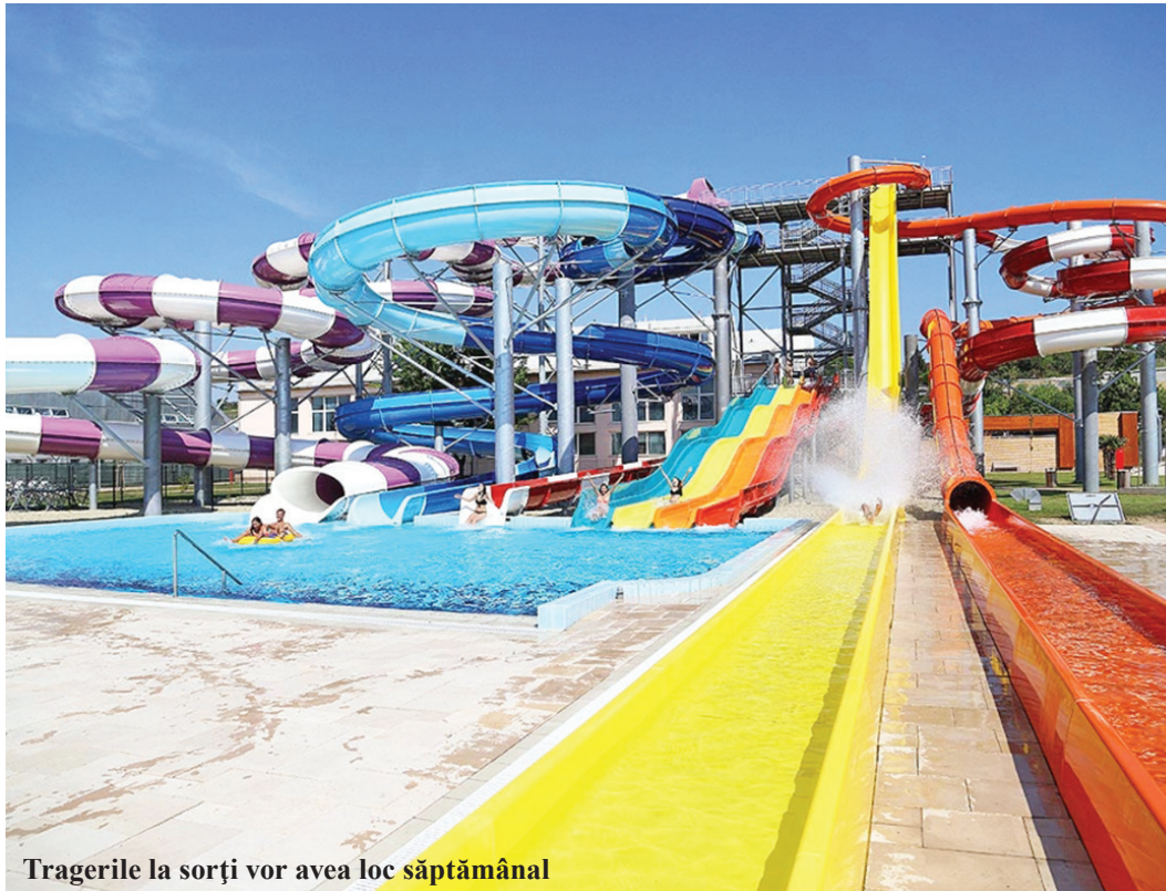
Tragerile la sorți vor avea loc săptămânal

La această promoție pot participa toate persoanele fizice, juridice și fizice autorizate care îndeplinesc cumulativ următoarele condiții: au vârsta minimă de 18 ani, plătesc integral dările locale datorate pentru anul 2020 în perioada 15 ianuarie - 31 martie. Fiecare persoană participă o singură dată la tragerea la sorți, în săptămâna în care a efectuat plata integrală, indiferent de numărul de tranzacții online (plăți) efectuate. Nu se iau în consi-