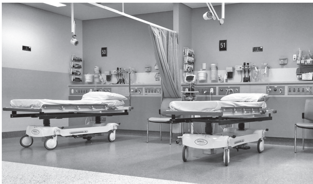
Numărul total al paturilor pentru spitalizare este 7.605

Faza 2 se bazează pe un număr de 14 spitale - 9 de boli infecțioase din faza 1 și 5 de pneumologie din țară, plus 34