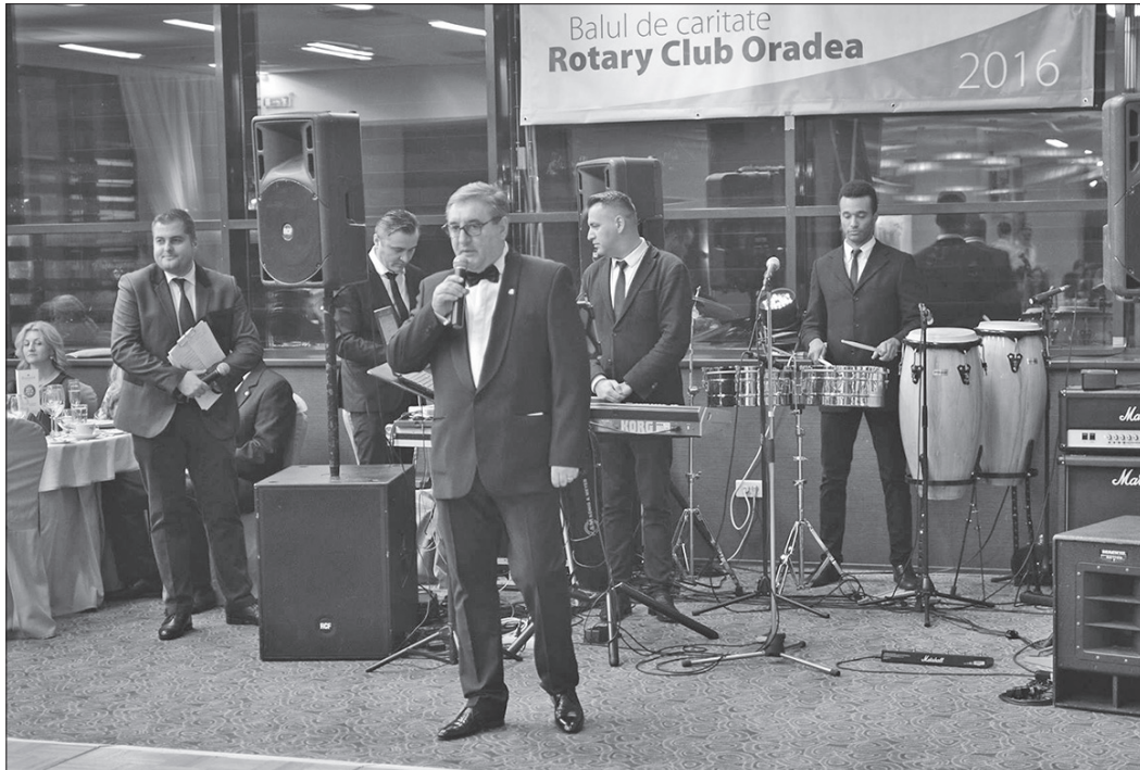
Balul Rotary Club Oradea a devenit o tradiție

Este vorba de proiectul „1.000 de oameni fericiți”, prin care 1.000 de persoane din județul Bihor vor beneficia de consult oftalmologic de specialitate și ochelari de vedere, în mod gratuit, precum și acordarea a 20 burse copiilor olimpici din liceele din Oradea și din Aleșd, proiect aflat, deja la cea de-a XI-a ediție. Mai mult decât atât, datorită implicării membrilor Rotary, acest al doilea proiect este deja în faza de finalizare. Premiера celor douăzeci de olimpici va avea loc în 20 decembrie 2016. Evenimentul se va desfășura la data mai sus menționată, în cadrul Hotelului Ramada Oradea, cu începere de la ora 19.00. „Balul Rotary Club Oradea a devenit o tradiție, fiecare ediție a acestui eveniment propunându-și aducerea în prim plan a unor cauze umanitare. La ediția