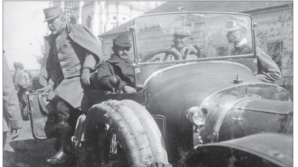
Generalul Constantin Prezan la Ditrău, Harghita, 1916

Ofensiva Armatei 1 austro-ungare întărită cu trei divizii germane având ca scop forțarea Carpaților Orientali, s-a desfășurat între 19 și 27 octombrie 1916. Toate încercările de forțare a trecătorilor (Tulgheș, Bicaș, Troțuș, Oituz etc.) au fost respinse de Armata de Nord (gral Prezan). Înfrângerea în bătălia decisivă de la Oituz și respingerea trupelor sale peste graniță au dus la decizia comandamentului central de a stopa operațiunea și a trece la defensivă pe frontul din Carpații Orientali.