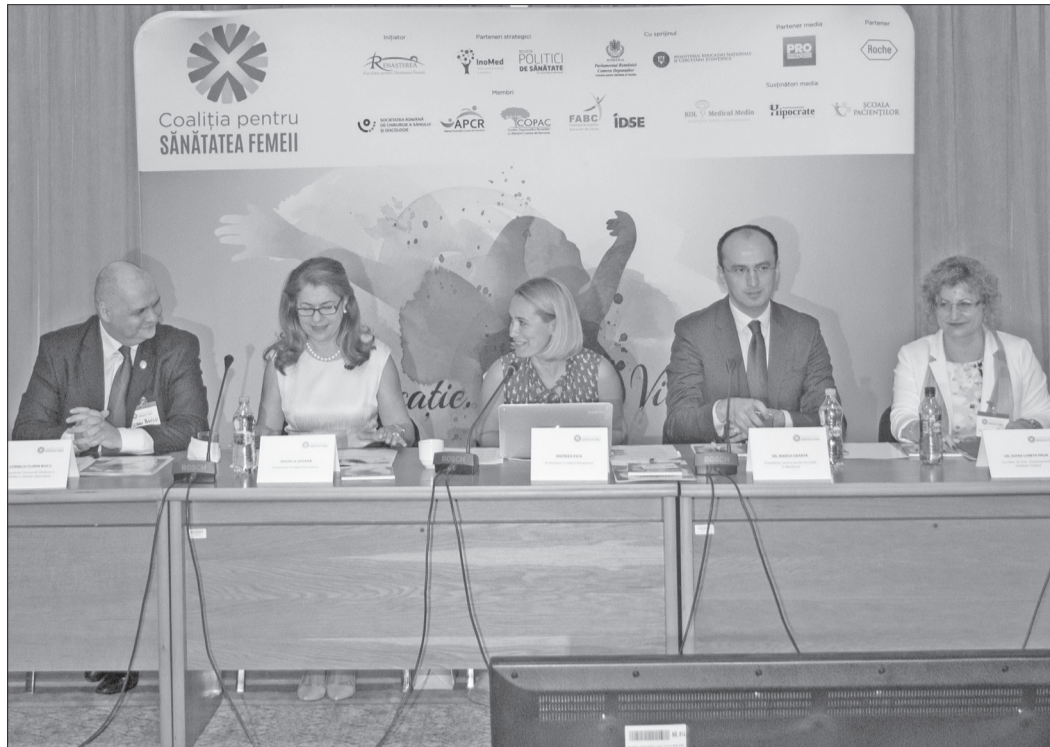
52% dintre românce nu știu cum se depistează cancerul

Din perspectiva medicilor, avantajele programelor de screening sunt evidente, peste