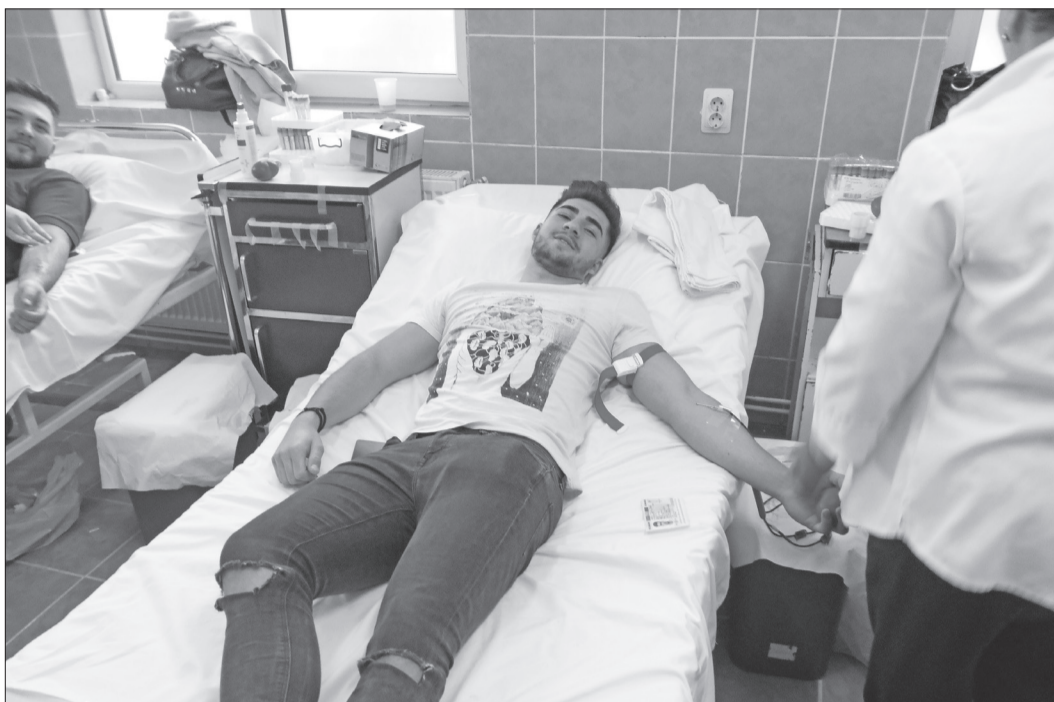
Inițiativa studenților este privită cu ochi buni