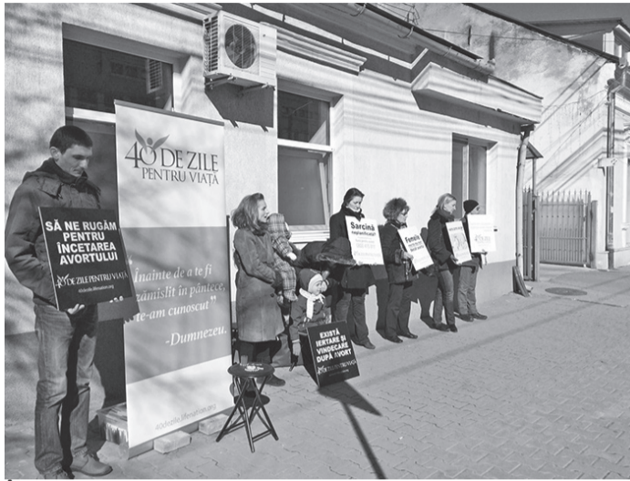
În 50 de ani au fost avortați peste 22 de milioane de copii

„Este important să se înțeleagă că noi nu suntem în fața maternității pentru a protesta, noi suntem pentru viața copiilor nenăscuți. Dacă am ajuns să ne ucidem propriii noștri copii, în pânțele mamei lor, asta este mai degrabă o involuție. Eu cred că suntem creați de Dumnezeu și că viața ne-a fost dată în dar de Dumnezeu. Nu putem să spunem că e viața mea și fac ce vreau cu ea, pentru că ni s-a dat ceva ce doar administrăm. Dacă ar fi fost a noastră, am fi decis când ne naștem și când murim. Avortul înseamnă crimă, cred că ar fi o