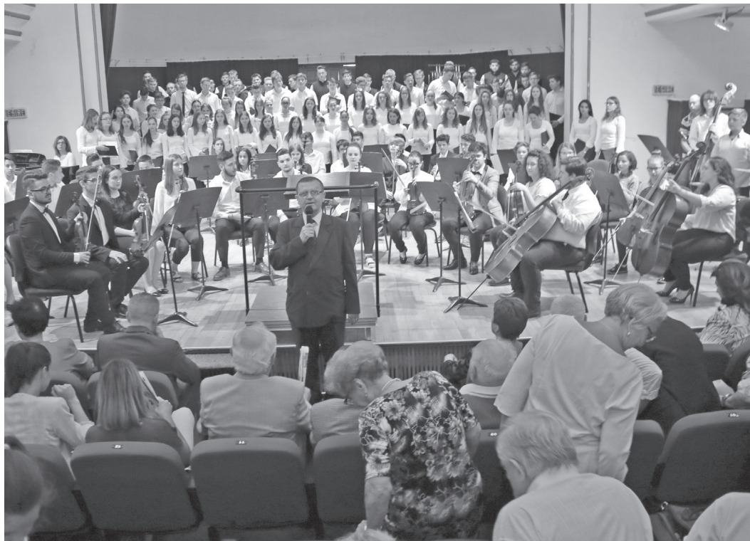
Prezență numeroasă la eveniment