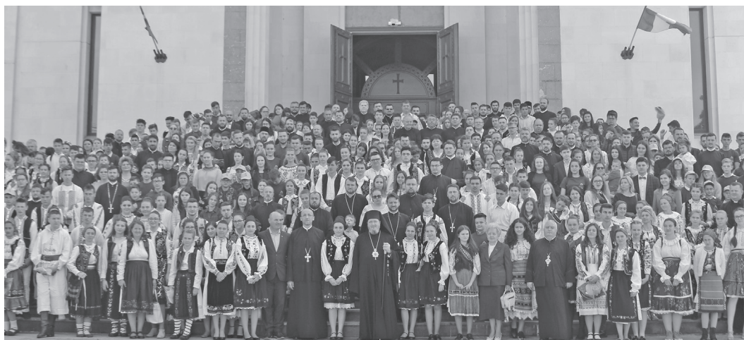
Întâlnirea tinerilor ortodocși bihoreni la Oradea