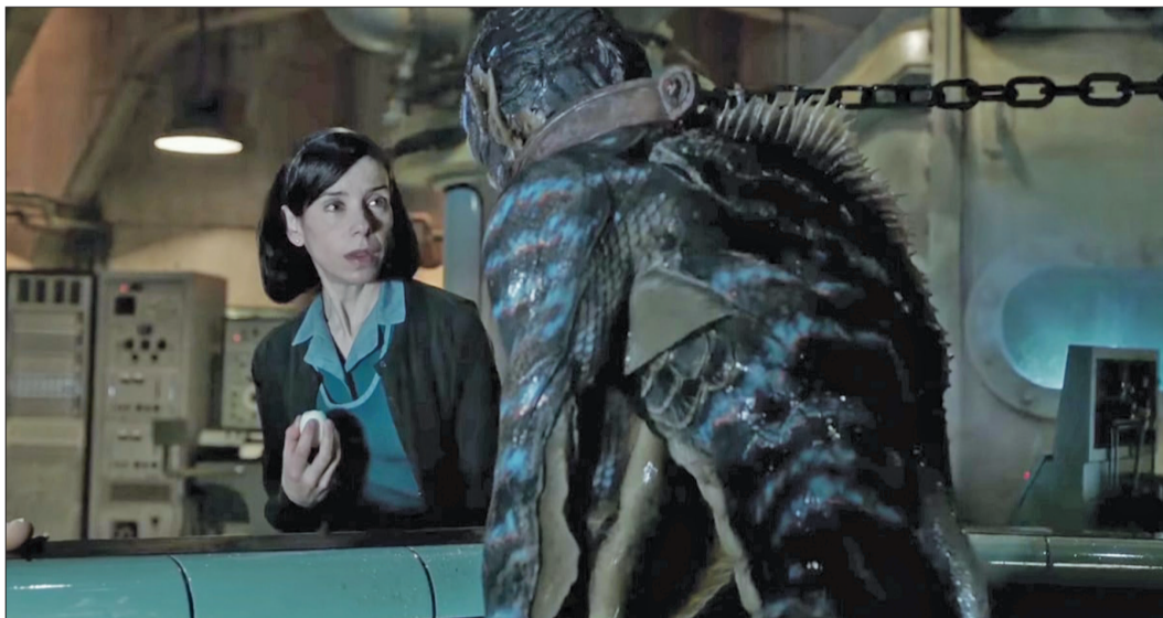
O poveste de dragoste fantastică dintre o femeie de serviciu mută și o creatură reptiliană

„Three Billboards outside Ebbing, Missouri” a primit la rândul lui duminică pentru cea mai bună distribuție de ansamblu, cea mai bună actriță și cel mai bun rol secundar masculin la SAG, premiile sindicatului