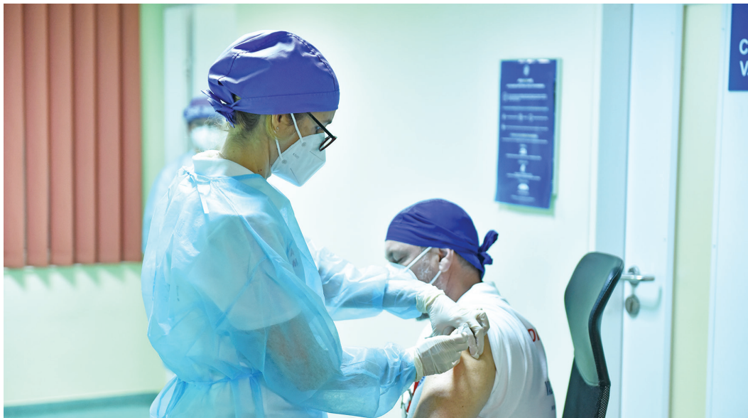
Zilnic în Bihor se vor vaccina câte 650 de persoane

„Este momentul pe care noi toți îl așteptăm de mai bine de 10 luni, toată lumea își dorește normalul, să revenim la liniștea și pacea pe care o aveam cu toții înainte de această pandemie. Faptul că avem un vaccin este dovada că trăim într-o lume medicală a tehnologiei și este o șansă de care trebuie să profităm. Încurajez pe toată lumea să vină la vaccinare. Astăzi (n.r. - ieri) în județul Bihor, concomitent în 12 centre, a început campania de vaccinare. La noi, la Spitalul Municipal, se vaccinează personalul medical care lucrează în unitatea Covid, iar în celelalte unități s-a început cu personalul propriu, urmând să se vaccineze toate cadrele medicale din unități și cabinete medicale individuale, farmaciști, stomatologi, studenți voluntari, toată lumea care lucrează în sistemul medical, inclusiv cei din compartimentele administrative. Începem cu un rapel și, la final, fiecare primește o adevărată în care se menționează data rapelului, urmând ca acesta să se repete la 21 de zile. Ne organizăm câte 5 la un flacon astfel încât să nu se piardă nicio doză. Vă rog din suflet, oriunde mergeți și ori de