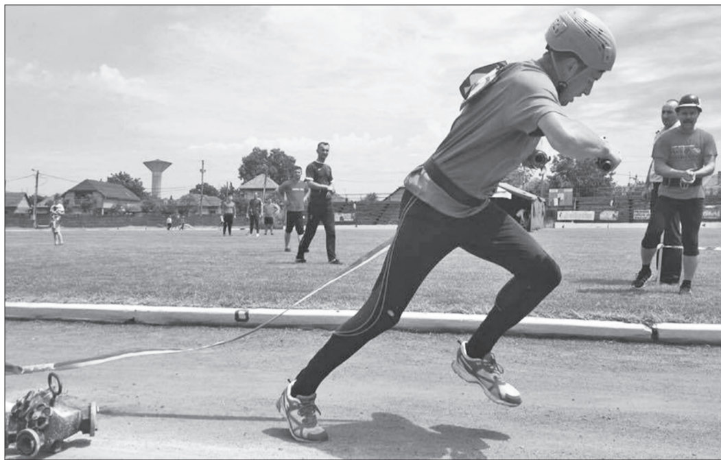
Prima treaptă a podiumului a fost ocupată de echipa Detașamentului de Pompieri Marghita

Pregătirea profesională, aptitudinile sportive și spiritul de fairplay ale pompierilor militari participanți la competiție au fost verificate timp de șase ore, pe parcursul celor patru probe specifice: „Scara de fereastră”, proba prin care se verifică deprinderile servanțului de a urca, în cel mai scurt timp și în siguranță, până la nivelul trei al unei construcții; „Pista cu obstacole pe 100 de metri”, proba individuală care urmărește abilitățile servanțului de a escalada gardul de doi metri, de a trece cu furturnurile în mână peste bârna de echilibru și de a realiza un dispozitiv de stingere, în cel mai scurt timp;