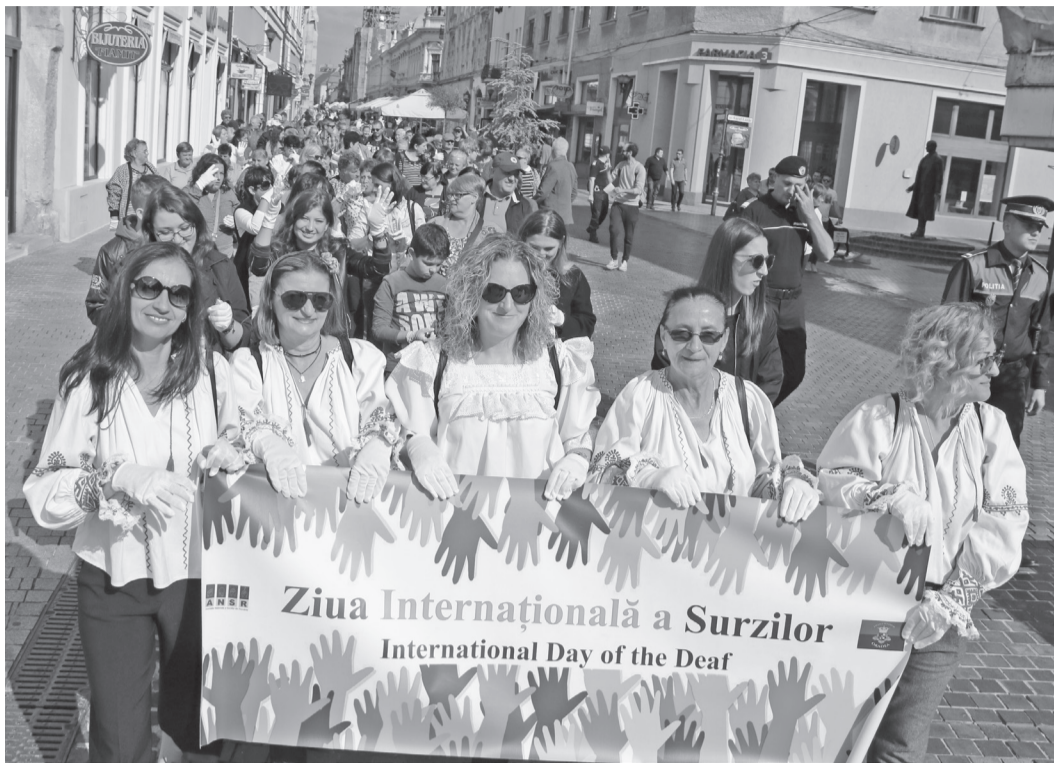
Peste 100 de bihoreni au defilat pe traseul Magazinul Crișul - Piața Unirii